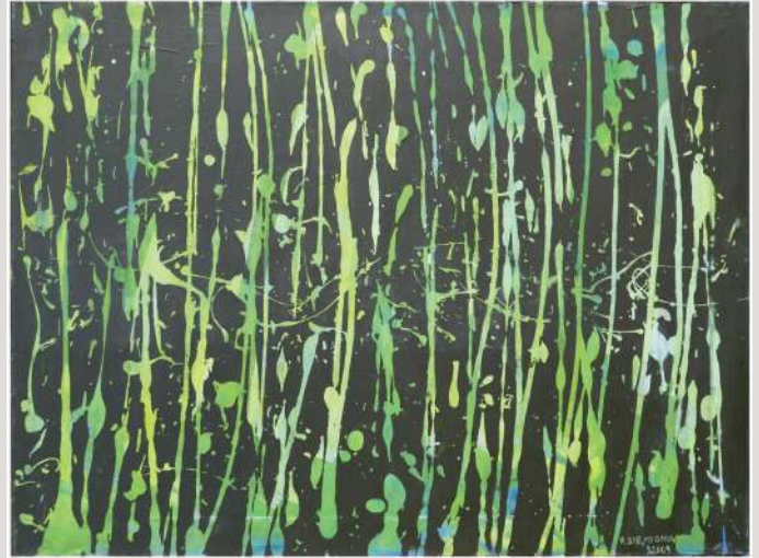
Hanna Siemionow – akryl, 70 x 50 cm