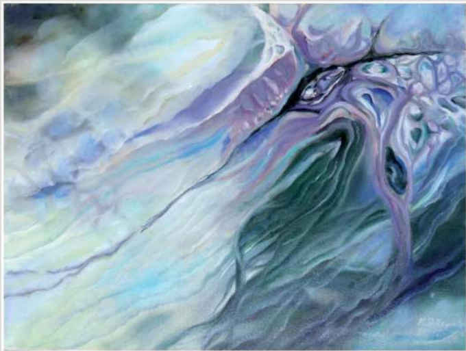
Małgorzata Dożyńska – olej, 70 x 50 cm