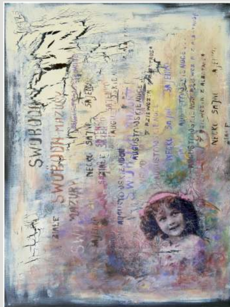
Aneta Piotrowska – akryl, 70 x 50 cm