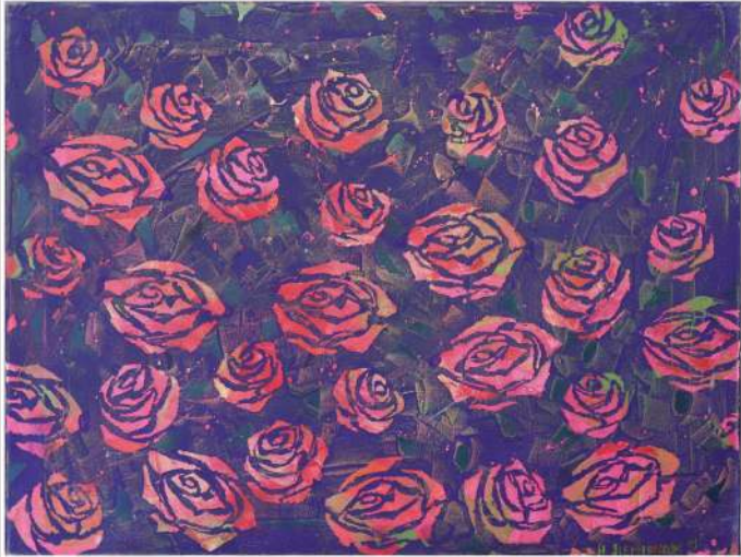
Hanna Siemionow – akryl, 70 x 50 cm