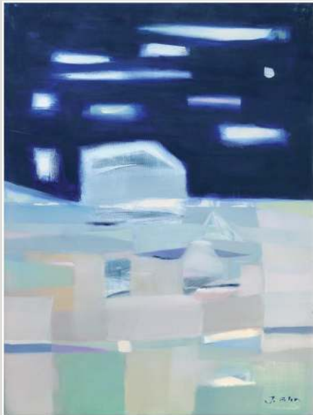
Joanna Golon – olej, 70 x 50 cm