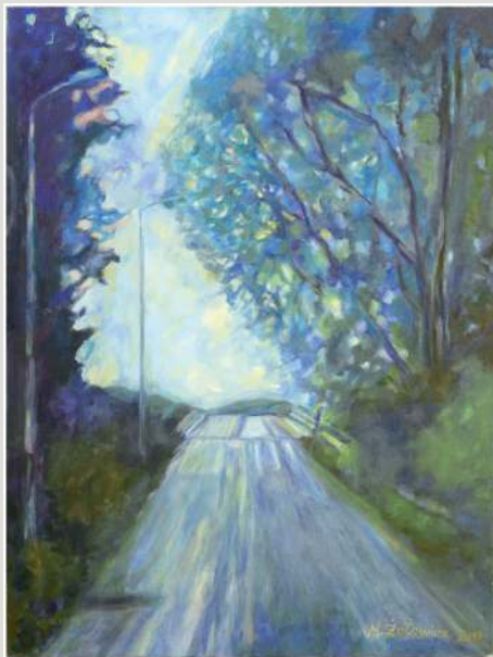
Maria Żółowicz – olej, 70 x 50 cm