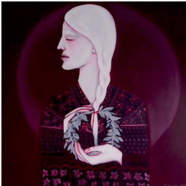
Daria Ostrowska – olej, 80 x 80 cm