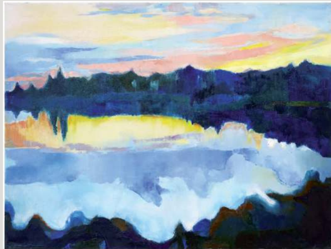
Jolanta Gałązka – olej, 70 x 50 cm