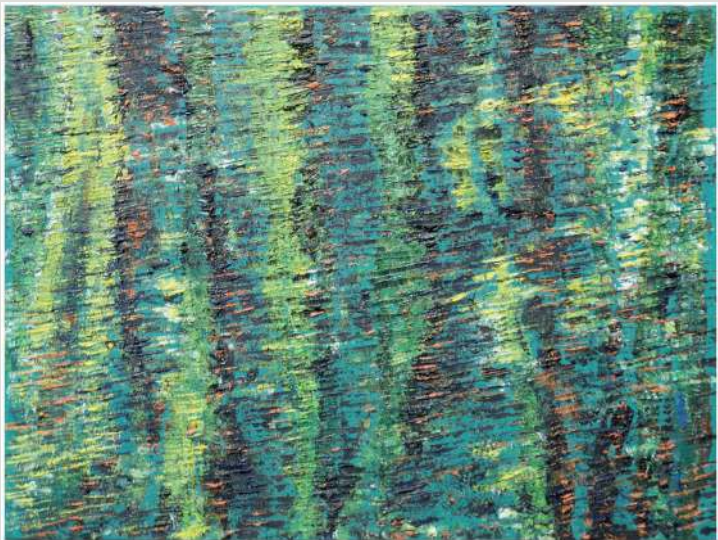
Agnieszka Sieniawska – olej 70 x 50 cm