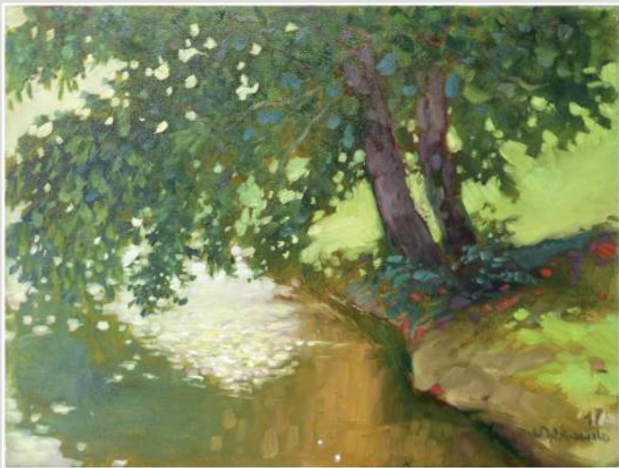
Włodzimierz Dąbkowski – olej, 70 x 50 cm