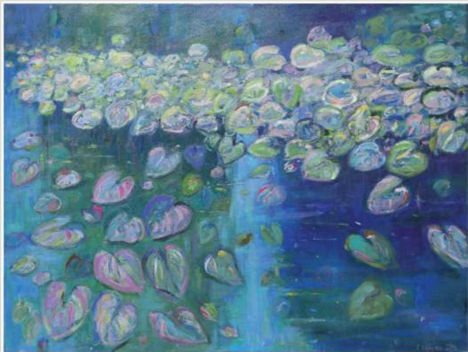
Cecylia Sołyjan – olej, 70 x 50 cm