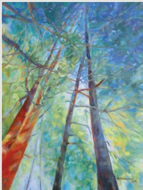
Alicja Chancewicz – olej, 80 x 60 cm