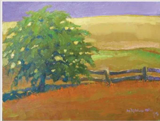
Włodzimierz Dąbkowski – olej, 70 x 50 cm