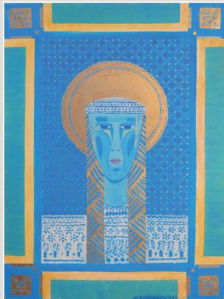
Hanna Siemionow – akryl, 70 x 50 cm