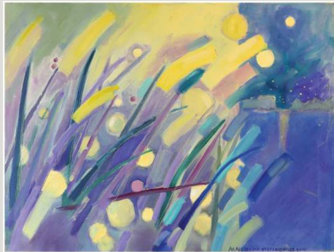
Małgorzata Stefanowicz – olej, 70 x 50 cm