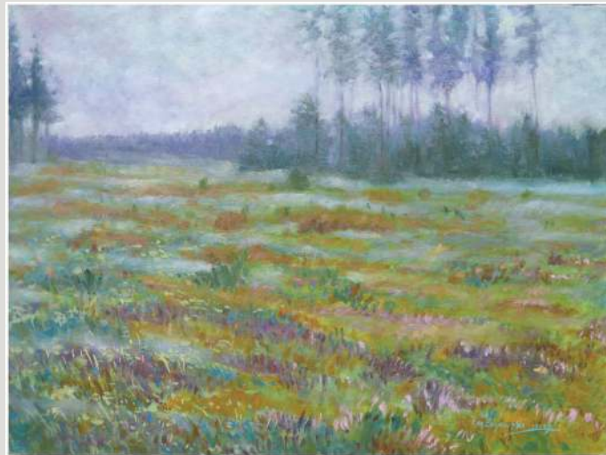
Marek Czyżewski – olej, 70 x 50 cm