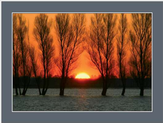
Jerzy Fedorowicz – fotografia, 70 x 50 cm