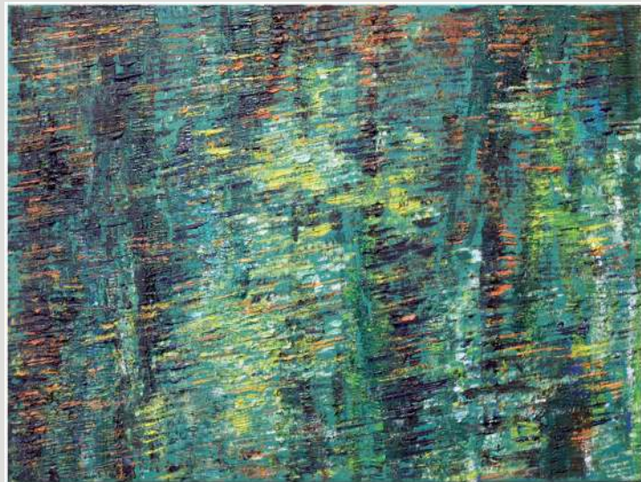
Agnieszka Sieniawska – olej 70 x 50 cm